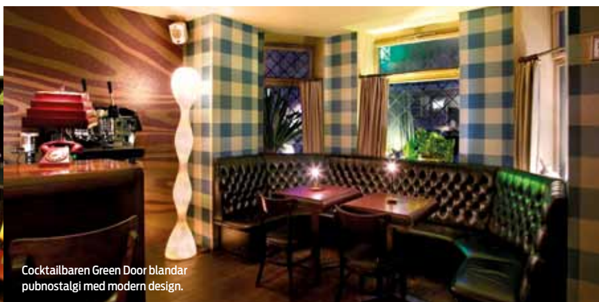
Cocktailbaren Green Door blandar pubnostalgi med modern design.