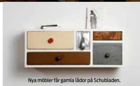
Nya möbler får gamla lådor på Schubladen.

”Det som tidigare var en nedgången del av Berlin är nu kartans hetaste punkt.”